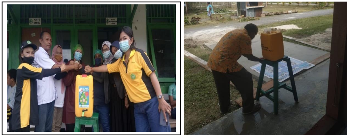
Gambar 3. Penyerahan alat pecuci tangan dari Tim bersama Puskesmas Biak Kota ke Kepala Kampung Samau