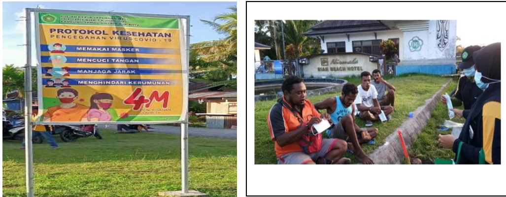
Gambar 4. Penyerahan tempat cuci tangan, pemasangan baliho dan pembagian masker pagi pengunjung Pantai samau BMG