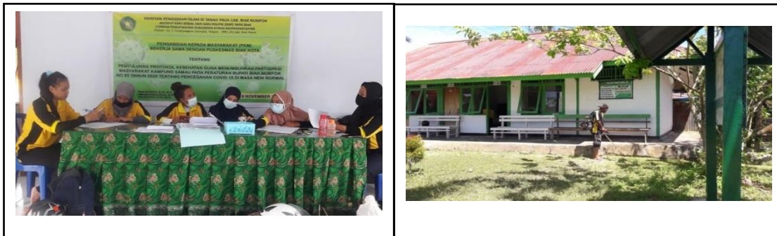
Gambar 1. Tahap persiapan pembuatan Undangan untuk masyarakat yang diundang

Pengetahuan seseorang dipengaruhi oleh beberapa faktor, antara lain tingkat pendidikan, pekerjaan, umur, factor lingkungan dan factor social budaya (Notoatmodjo, 2010). Pada pengabdian ini adanya peningkatan pengetahuan masyarakat di ikuti adanya peningkatan perilaku masyarakat dalam pencegahan penyebaran virus corona. Hasil pengabdian ini didukung dengan hasil penelitian yang dilakukan oleh Yanti B, dkk (2020). Berikut dokumentasi kegiatan Tahap persiapan dan Tahap pelaksanaan Sosialisasi.