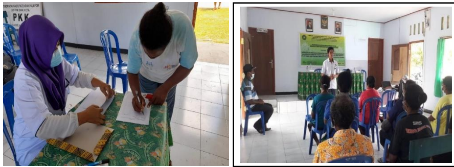
Gambar 2. Pelaksanaan Kegiatan Sosialisasi Penerpaan Protokol Kesehatan bersama Puskemas Biak .