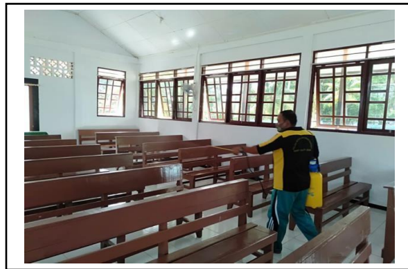
Gambar 5. Penyemprotan Disfektan kerumah Ibadah dan Pustu