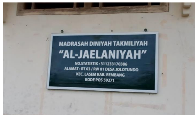
Gambar 4. Papan Nama Sekolah Madrasah Diniyah Al Jaelaniyah

Pendampingan selanjutnya adalah dengan melengkapi atribut-atribut yang dibutuhkan untuk sekolah Madrasah Diniyah Al Jaelaniyah meliputi pemasangan papan nama sekolah, doa-doa untuk di kelas dan memasang papan pengumuman untuk di kelas.