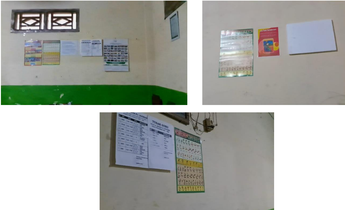
Gambar 5. Atribut di kelas Madrasah Diniyah Al Jaelaniyah