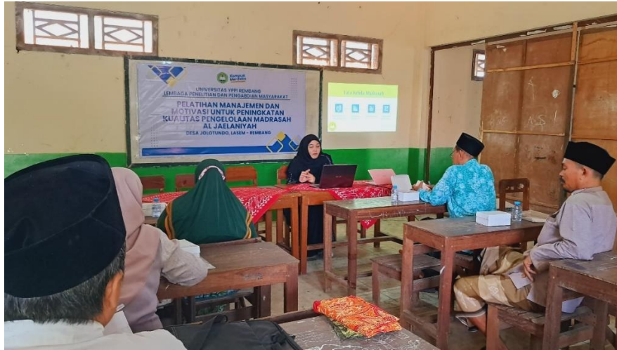
Gambar 3. Pemateri Memberikan Materi Manajemen Pengelolaan Sekolah