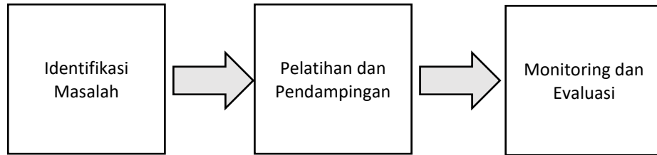
Gambar 1. Tahapan kegiatan pengabdian kepada masyarakat