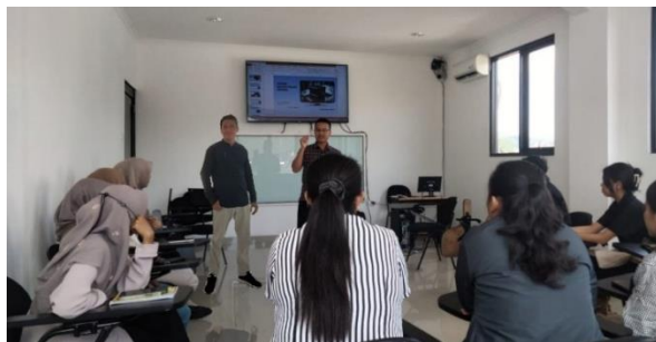
Gambar 2. Tingkat partisipasi Pelaku UMKM Dalam Pelatihan dan Pendampingan

Dalam melakukan pelatihan oleh Tim Pengabdian kepada Masyarakat Universitas STEKOM Semarang dengan jumlah peserta yang hadir sebanyak 15 orang dari pelaku UMKM kabupaten Semarang. Para peserta pelaku UMKM yang hadir diminta mengisi terlebih dahulu daftar hadir yang telah disediakan oleh panitia, kemudian Tim Pengabdian kepada Masyarakat membagikan masing-masing fotokopi materi pelatihan yang akan diberikan kepada pelaku UMKM. Kegiatan pengabdian kepada masyarakat sebagai wujud tanggung jawab Universitas STEKOM Semarang sebagai Lembaga pendidikan berperan aktif untuk memberikan pelatihan adapun proses kegiatan pelatihan dapat ditunjukkan Gambar 2 sebagai berikut.