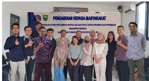
Gambar 4. Akhir acara pelatihan dan pendampingan sebagai bentuk perwujudan rasa terima kasih

Selama pemaparan materi yang diberikan adalah lima materi terlihat antusias peserta dengan langsung mengajukan pertanyaan yang berkaitan dengan kendala dibidang promosi dan informasi branding produk, dan terdapat beberapa peserta pula yang berminat untuk belajar lebih lanjut mengenai cara pembuatan kemasan dan label yang benar untuk meningkatkan daya tarik terhadap produk yang dijualnya. Selain itu, beberapa peserta sudah mulai mendownload aplikasi dari bisnis digital dalam bentuk promosi dan informasi dan mulai melakukan pendaftaran ke beberapa platform e-commerce. Di akhir acara pelatihan dan pendampingan sebagai bentuk perwujudan rasa terima kasih dan juga kerjasama antara Universitas STEKOM Semarang dan pada pelaku UMKM kabupaten Semarang, Universitas STEKOM Semarang memberi kenang kenangan cinderamata berupa plakat dari Universitas STEKOM Semarang yang diterima secara langsung oleh ketua pelaku UMKM.